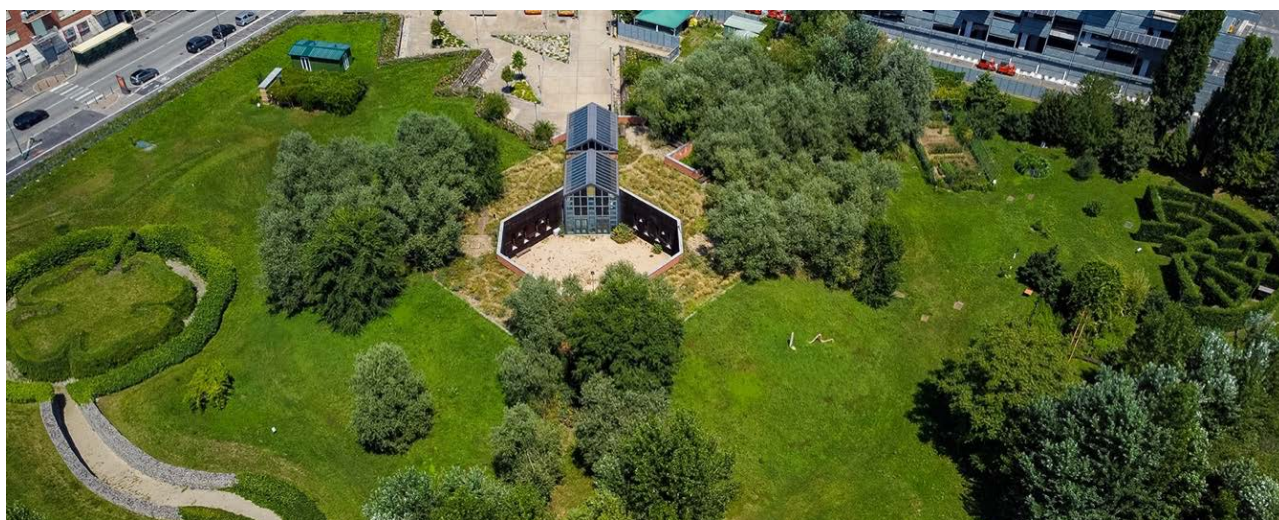
Il PAV Parco Arte Vivente, Centro sperimentale d'arte contemporanea, Torino

Incontri illuminanti con l'Arte contemporanea 2022 è promosso dalla Città di Torino , in cooperazione con i Dipartimenti Educazione dei musei cittadini, con il coordinamento della Fondazione Torino Musei .