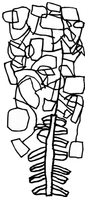
Euforbia, PAV Colouring Book

PAV is an experimental centre for contemporary art that includes an open-air exhibition site and an interactive museum, meant as a place for meetings and workshops dealing with the ongoing dialogue between art and nature, biotechnology and ecology, between public and artists.