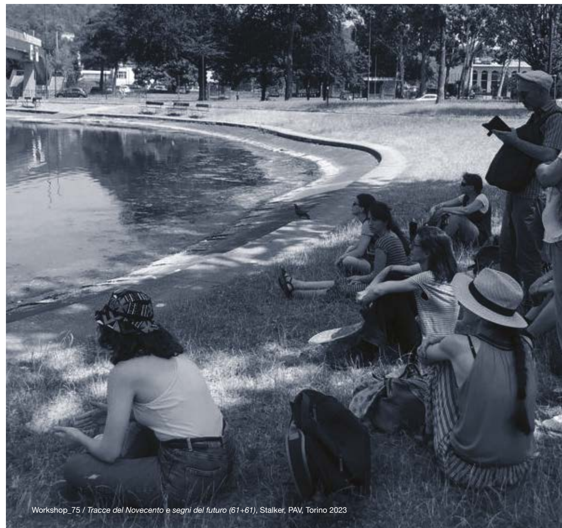
Workshop_75 / Tracce del Novecento e segni del futuro (61+61), Stalker, PAV, Torino 2023

Programmi aggiornati sul sito https://parcoartevivente.it/workshop/