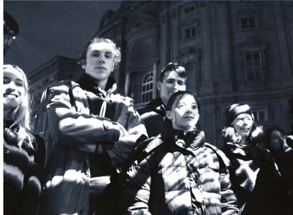
Accademia della Luce 2023/Space is the Place, Piazza Carignano, Torino 2023

Percorso gratuito in più incontri dedicato alle Scuole primarie cittadine Per l'aggiornamento sul programma: https://parcoartevivente.it/accademia-della-luce/